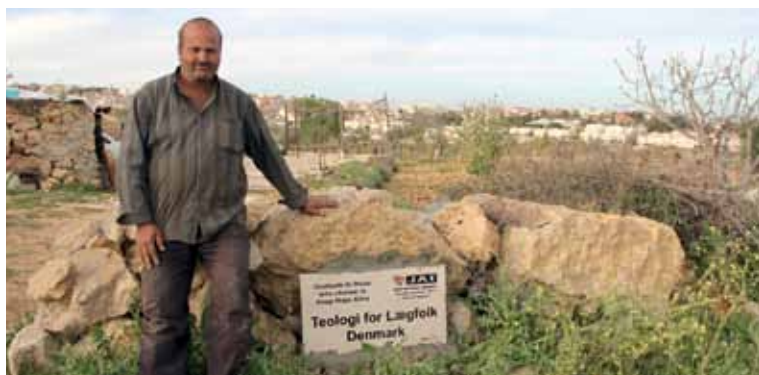
TFL støtter plantning af oliventræer i Palæstina.

Uge 26: 24. juni - 26. juni begge dage inklusive