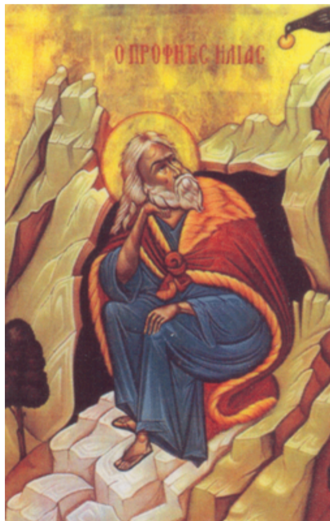
Profeten Elia får mat av korparna vid bäcken Kerit.

Näst efter Mose räknar judendomen Elia som den störste profeten. Hans verksamhet omtalas i Första Kungaboken 17 – Andra Kungaboken 218 . Elias stora uppgift var att föra folket tillbaka till tron på den ende Guden – Herren , sedan de även börjat tillbe Baal , en kanaaneisk fruktbarhetsgud. En av Elias lärjungar – Elisha eller Elisa – tog upp hans fallna