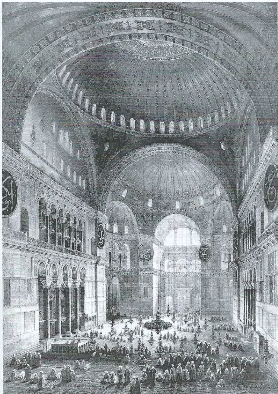
Den monumentale Hagia Sofia-kirken ble bygd av keiser Justinian på 530-tallet. Tyrkerne gjorde den til moské. Tegningen er fra 1852. I dag er bygningen museum.

Kirke og stat. Det østromerske – eller bysantinske – riket var en direkte fortsettelse av det gamle Romerriket. Både keiser og kirke kunne se seg som arvtakere til den kristne stat som var utformet på 300-tallet. Keiseren regjerte med et gud-