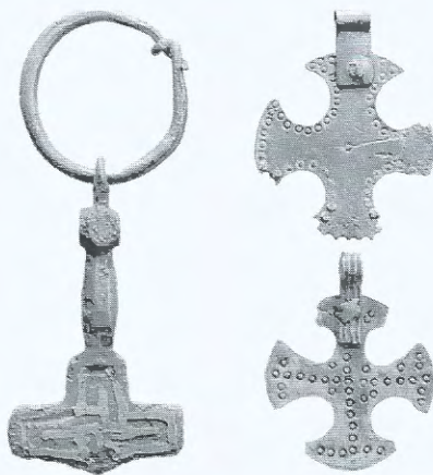
Halsamuletter av hammer og kors fra religionsskiftetiden. Som beskyttelsesgud konkurrerte Tor lenge med Hvitekrist.

Fastholdes må det i alle fall at religionsskiftet i Norge gikk sammen med en omdanning av samfunnsorganisasjonen, der kristendommen kom til å befeste det nye rikskongedømmets herskerideologi. Kongemakt og kirke hørte sammen. Ikke bare var kristendommen et middel til å styrke statsmakten, også kristendommen selv tok preg av dette. Det er den seirende og herskende Kristus som er fremtredende i norsk ikonografi, og også i den religiøse diktningen, til langt ut på 1100-tallet. Det er den seirende kongen som hersker, i himmelen så vel som på jorden.