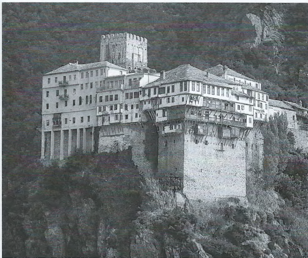
Dionysiou-klosteret på Athos-fjellet. Dette er en av mange klosterbygninger på Athos. Klostersamfunnet her ble grunnlagt på 900-tallet, og kom til å bli et viktig åndelig sentrum i den ortodokse kirke.

komplementært. Mens kirken selv ble tvetydig i forhold til det verdslige, dyrket munkevesenet en entydig ikkeverdslighet. Sammen uttrykker de spenningen mellom den utenomverdslige og den innenverdslige dimensjonen i kristendommen.