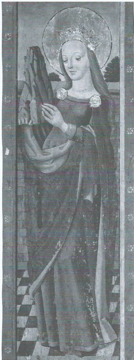
Den hellige Sunniva, Vestlandets vernehelgen. Fra et alterskap i Trondenes kirke i Troms. Nå i Bergen Museum.

I faglitteraturen har man ofte klassifisert misjonsmetodene i tidlig europeisk middelalder i tre kategorier: ordmisjon, handlingsmisjon og sverdmisjon. Kristningen av Norge er et hovedeksempel på «sverdmisjon» – Karl den stores metoder overfor sakserne og friserne er et annet eksempel. Fortellingen om Dale-Gudbrands omvendelse tilhører derimot snarere kategorien «handlingsmisjon» – det som skjedde der, ligner på Bonifatius' metode i Hessen, der han hogg ned Tors hellige eik og viste at guden var maktesløs. «Ordmisjon» ble tydeligvis mindre brukt som omvendelsesstrategi i Norge. Derimot kan prekenamlinger som Gammel norsk homi-