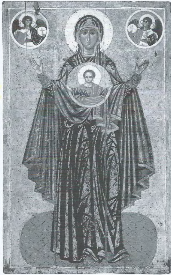
Russisk Madonna-ikon, ca. 1224. Jomfruen holder armene i bønnestilling: hun gjør forbønn for de troende.

Ikoner er til stede i dagliglivet, som gjenstand for privatfromhet i private hjem. De er også vesentlige og nødvendige deler av kirkerommet. Mellom koret – «det hellige» – og kirkeskipet går i alle ortodokse kirker ikonostasen , en vegg dekket av ikoner etter et nærmere fastlagt program. Kirkerommet avbilder slik de to verdener, og mellom dem står ikonene – på samme tid avgrensning og bindeledd. Under gudstjenesten, som selv er fylt av både sanseintrykk og symbolikk, utspilles inkarnasjonens mysterium gjennom prestens prosesjon gjennom ikonostasens porter, slik det også gjør det gjennom nattverdsritualer, der Frelseren er til stede i kjøtt og blod. Slik henger ikonene nært sammen med den ortodokse kirkens rituelle praksis så vel som med dens frelselære.