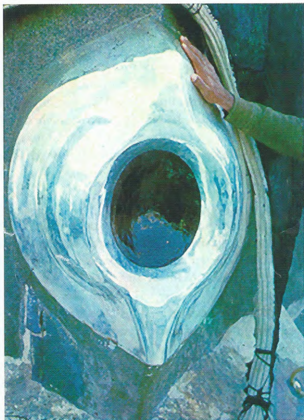
Den sorte sten.

Tiden før Muhammads fremtræden som profet er af muslimerne blevet kaldt "uvidenhedens tid". Religionshistorisk har der været tale om en typisk naturreligion, centreret omkring kaba'en i Mekka. Denne bygning er sandsynligvis ældre end byen selv, placeret på en "neutral" grund midt i et