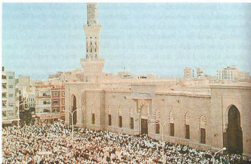
Moskéen i Medina.

På dette sted angives Muhammad at have slået sig ned, da han kom til Medina; her byggede han sit hus, der grænsede op til en åben plads, hvor han kunne prædike for sine tilhængere. I forbindelse med valfart til Mekka er det almindeligt at de troende også aflegger besøg i Medina.